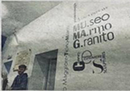
Il «museo del marmo e del granito» di Mergozzo e la «sala espositiva» nella cava di Ornavasso. A sinistra le due cerimonie di inaugurazione di ieri mattina

Maggiore, Ticino e Naviglio Grande al cantiere della magnifica cattedrale milanese. È una storia affascinante, come il lavoro nel laboratorio di Candoglia degli ornati, creatori dei pezzi di ricambio per le guglie all'ombra della Madonnina, che ha sempre più richieste di visite. Il MuMag, il Museo del marmo e del granito di Mergozzo, ora entrerà a far parte di questo viaggio lungo l'antica via di acqua e pietra, con le cave che attinsero alla medesima vena mineraria e che stanno sull'altra sponda del Tocco, a Ornavasso, sulle pendici del Boden.